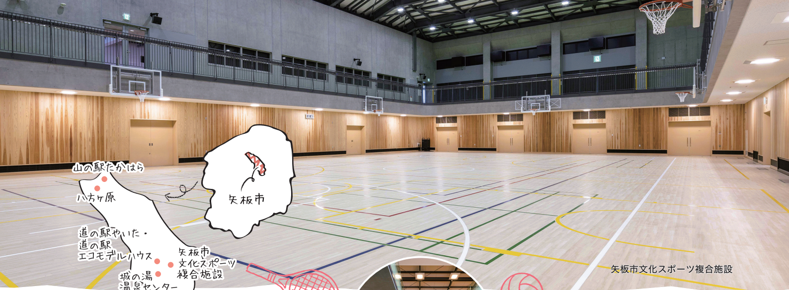
矢板市文化スポーツ複合施設

栃木県の北東部に位置する矢板市。八方ヶ原・高原山など四季を通じて自然を満喫できるエリアとなっています。そのほかにも、スポーツツーリズムの拠点である「矢板市文化スポーツ複合施設」や、地元農家が栽培した朝採れ野菜が揃う「道の駅やいた」、良質な湯が湧く「城の湯温泉センター」などさまざまな魅力あふれるスポットがあります。